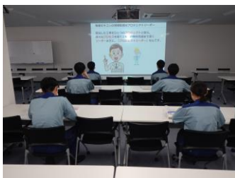
会社説明・業界研究