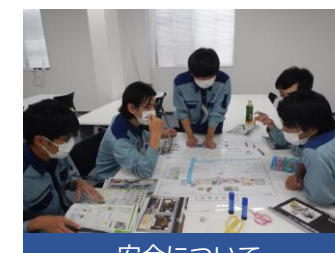
安全について グループワーク