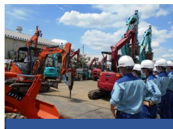
建設資機材等体験・見学