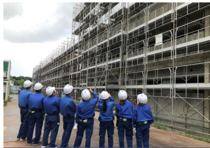
建築施工管理現場体験