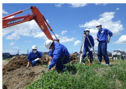
土木施工管理現場体験